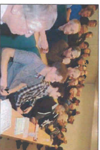
Mye folk. Det var stor interesse blant skogeterne i Rauma og Vestnes for møtet på Gjermundnes.

– Jeg kan garantere at ingen skal få regning etter at jobben er gjort. Noen vil kanskje kunne få opp