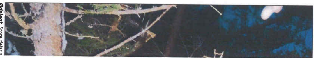
Ødelagt. Store delar a

Stein Slem slem@andalsnesavis.no 71 22 77 25, mobil 91 510 585