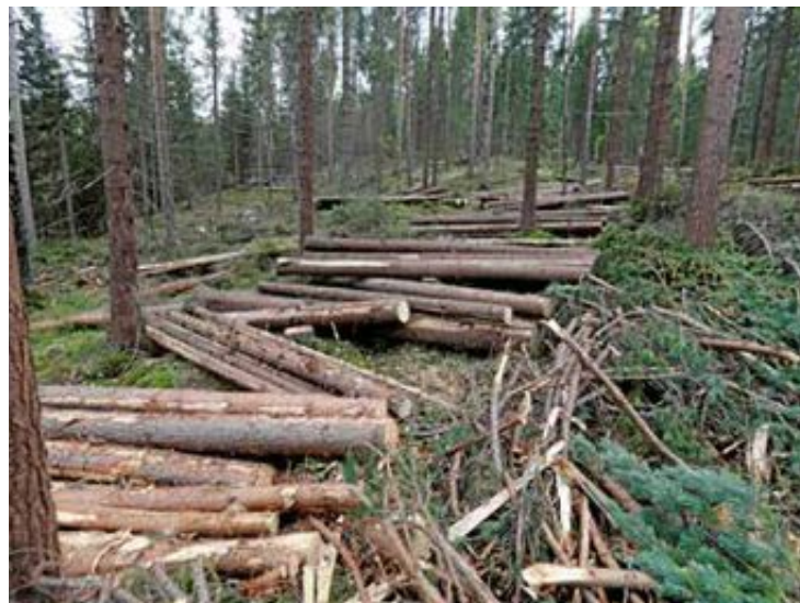
Råstoff: Skogeiere og treindustri må samarbeide bedre, skriver lesarbrevforfatterne.