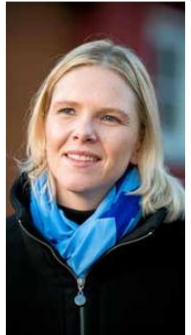
Trumf: Christian Tybring-Gjedde og Sylvi Listhaug er gode Frp-kort, skriver lesarbrevforfatteren.