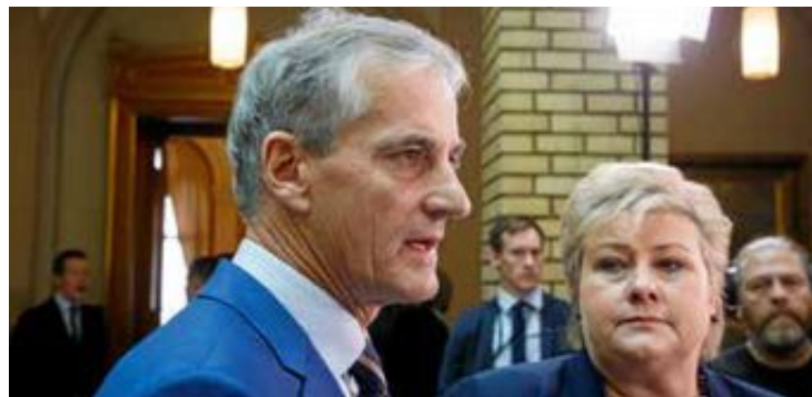
Ser dobbelt: Jonas Gahr Støre (Ap) og Erna Solberg (H) er i mange saker like, skriv lesarbrevforfatteren.

Det er viktig at dette blir ei hovudsak i valkampen for det er dette som kjem oss nærast inn på livet og i praksis vil forandre landet vårt. Trass i at Norge i dag er svært rikt i forhold til då landet blei bygt opp i etterkrigsåra,